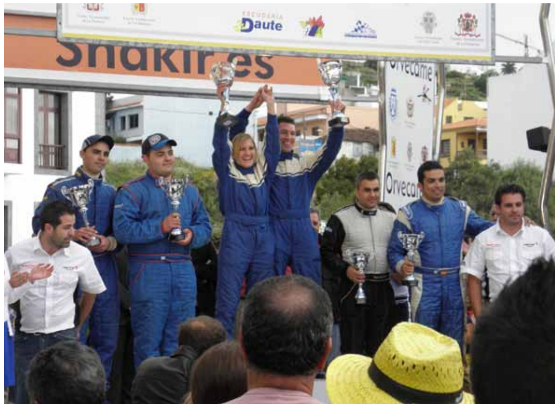
Los hermanos de Francisco en el rally Norte donde fueron ganadores del trofeo Saxo y subieron a lo más alto del podio.