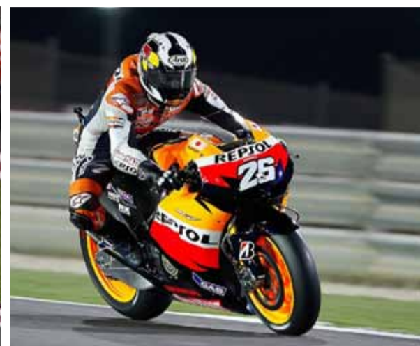
Dani Pedrosa 3º, con problemas físicos, no aguantó el ritmo.