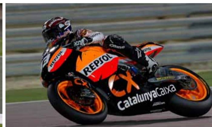
Marc Márquez no consiguió mantener un ritmo demasiado ambicioso.