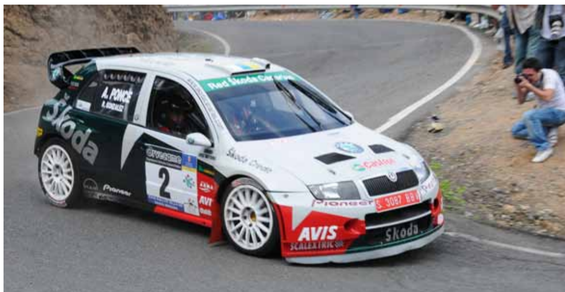
Rally de Santa Brígida (Pág. 9)