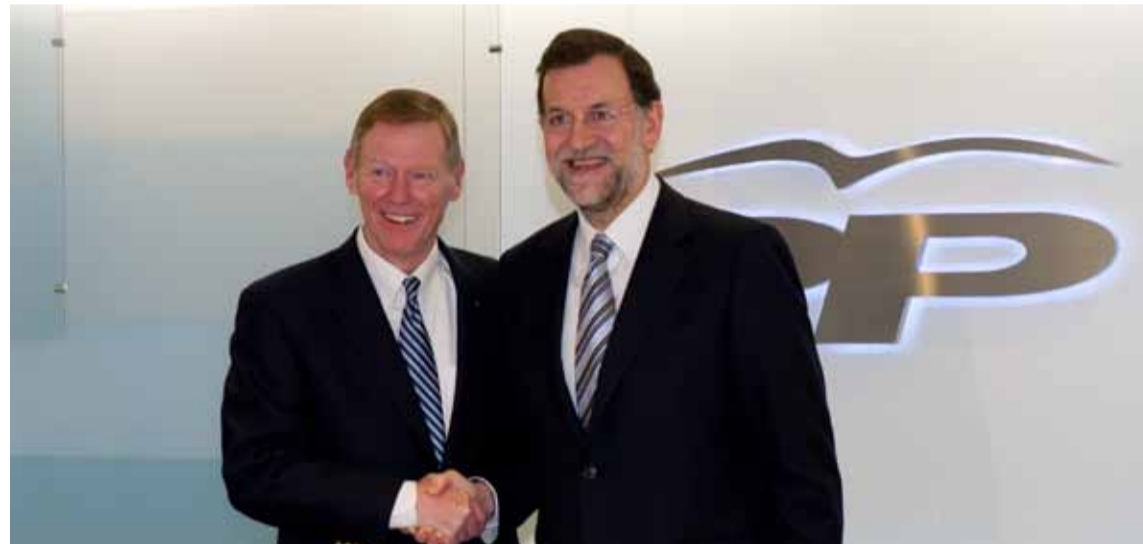
El Presidente Mundial de Ford, Alan Mulally, visita a Mariano Rajoy en las oficinas del Partido Popular

En la audiencia en la Zarzuela, S.M. el Rey y el ejecutivo estadounidense intercambiaron impresiones sobre el futuro de la fábrica de Almusafes y su importancia para la introducción en España de los vehículos híbridos eléctricos.