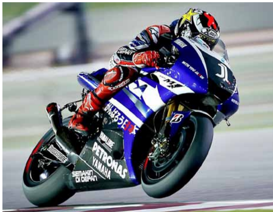
Jorge Lorenzo con una buena salida y a pesar de los entrenamientos quedó segundo.