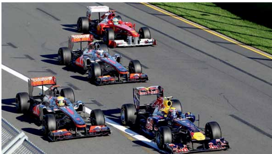
Desde unos buenos entrenamientos y el inicio de carrera Hamilton se ganó un merecido segundo puesto.