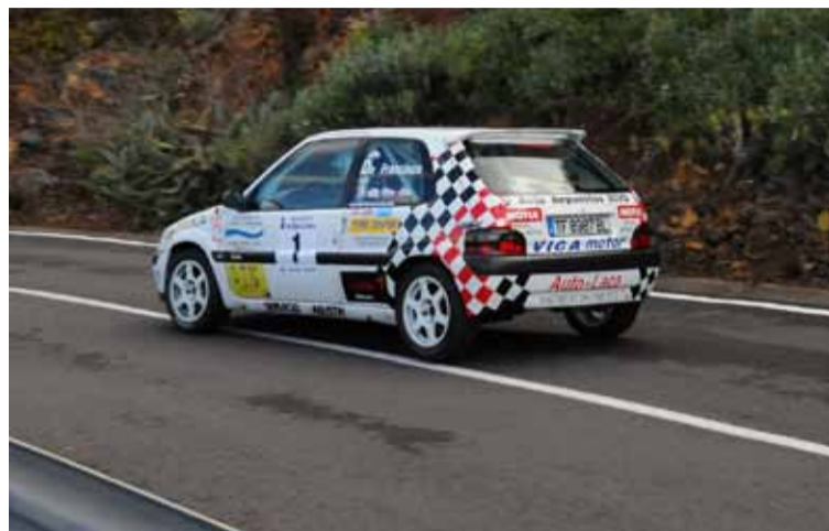
Una buena subida pero su primera prueba no será la mejor de su vida.