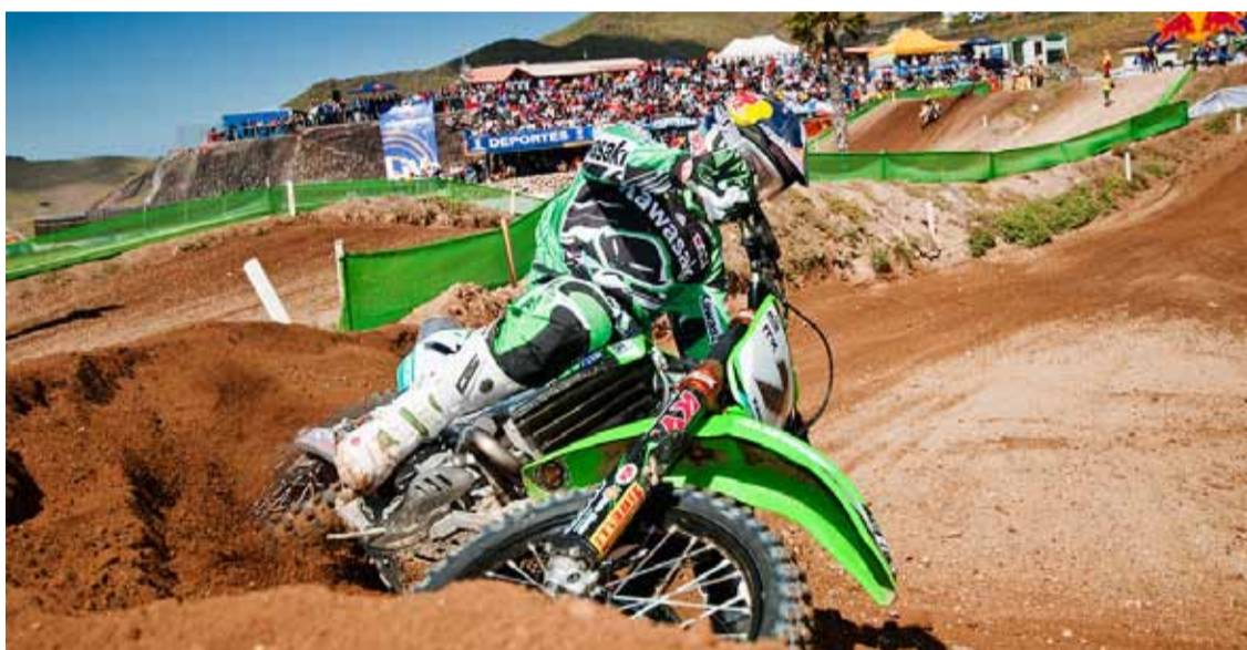
La Fiesta del MX (Págs. 10 y 11)