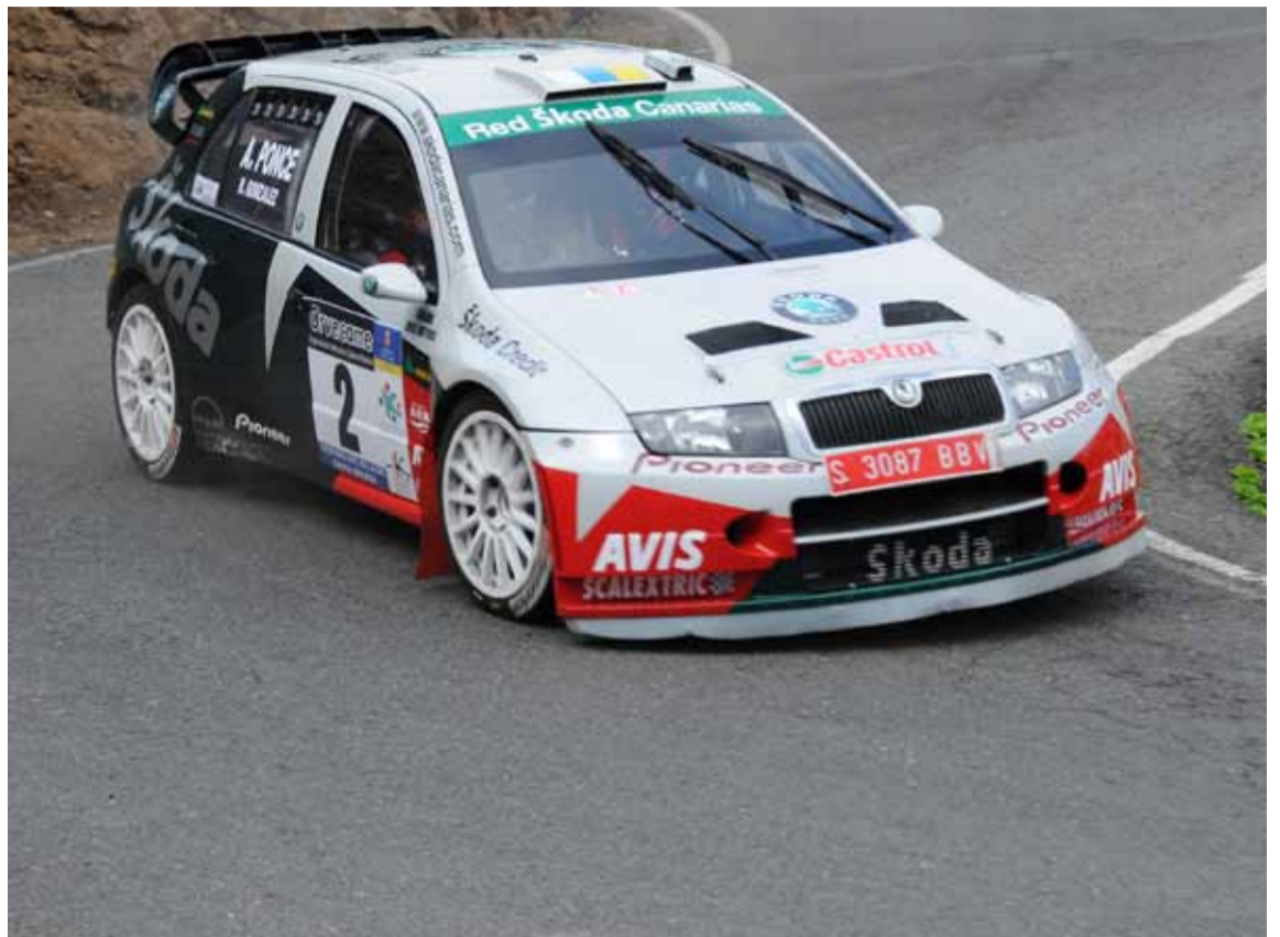
Toñi Ponce volvió a demostrar que donde hubo siempre queda.