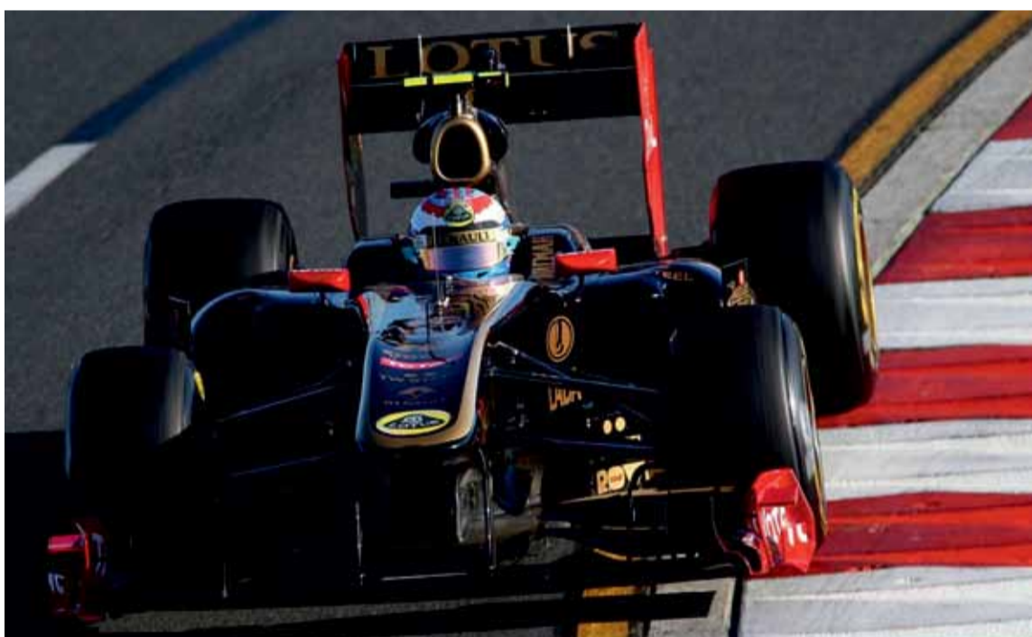
Vitaly Petrov fue la sorpresa de la carrera. Realizó un carrerón y se colocó tercero. Alonso no pudo con él.