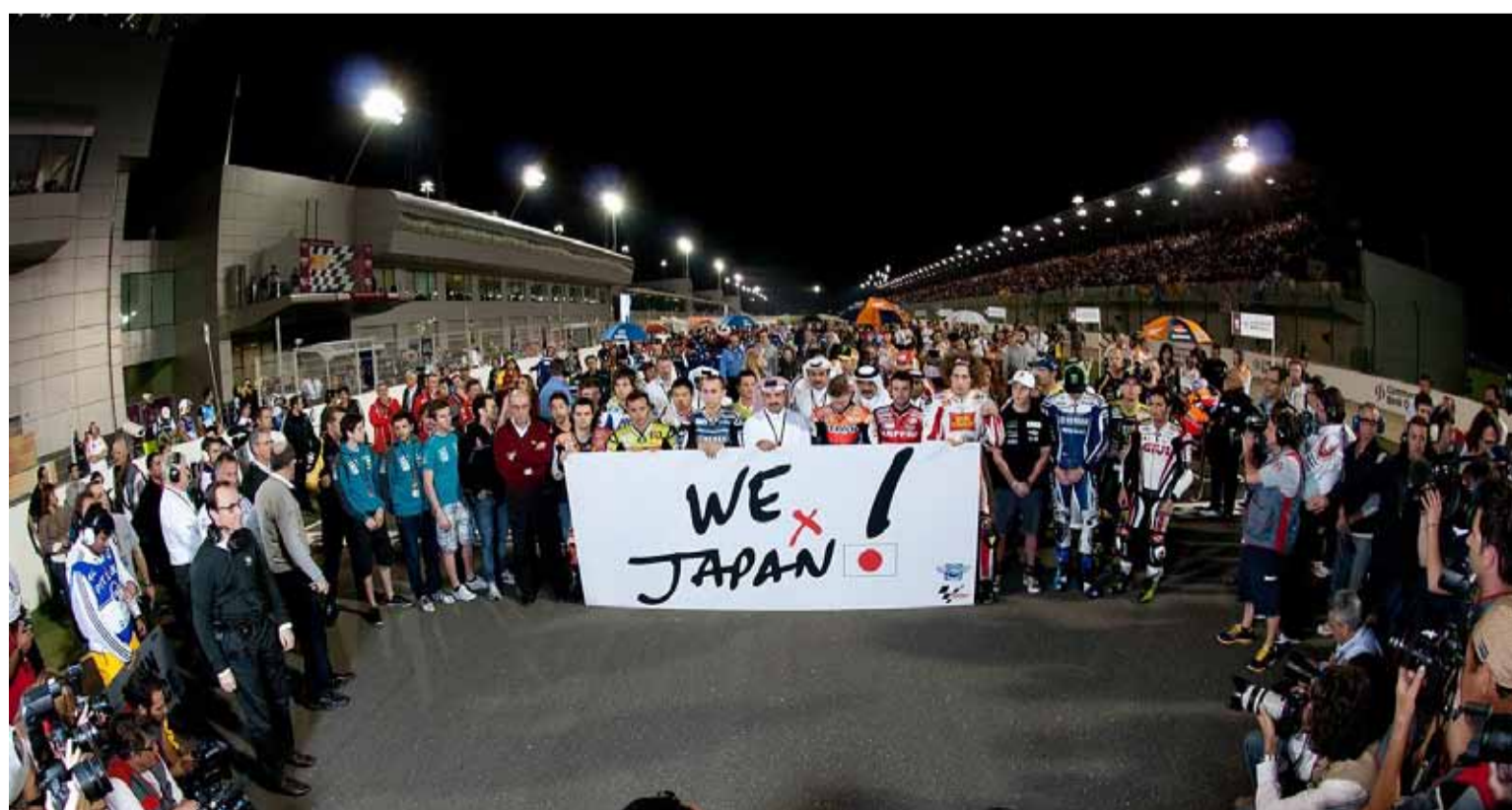
Solidaridad con Japón. Se celebró un minuto de silencio por las víctimas del pasado maremoto y posterior tsunami.