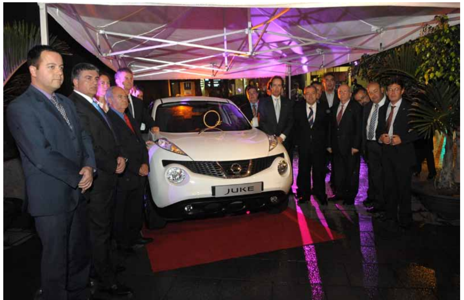
El premio es el único reconocimiento al automóvil en el archipiélago.