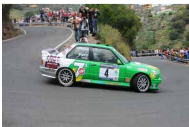
4º JM Ponce/Larrodé cuajaron otro magnífico rally.