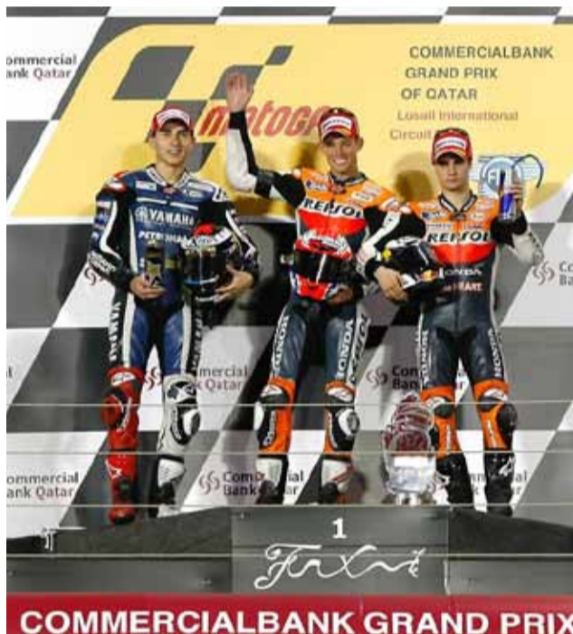
Podio de MotoGP. 1º Stoner, 2º Lorenzo y 3º Pedrosa.