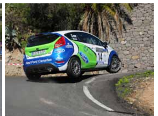
1º C2 Cruz/Rivero volvieron a imponer su ley.