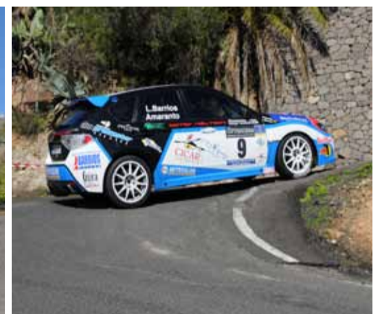
Barrios/Amaranto segundos en GrN.