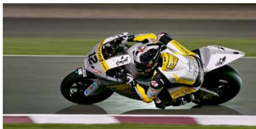
Thomas Luthi tercer clasificado en Moto2.