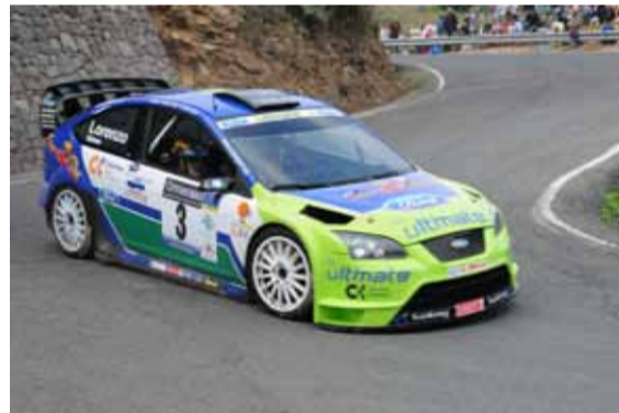
2º Lorenzo/Gomez tuvieron un buen estreno del Focus WRC