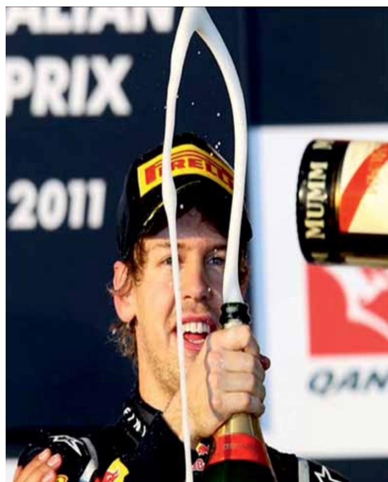
Sebastian Vettel inicia la temporada recordando quien es el campeón.