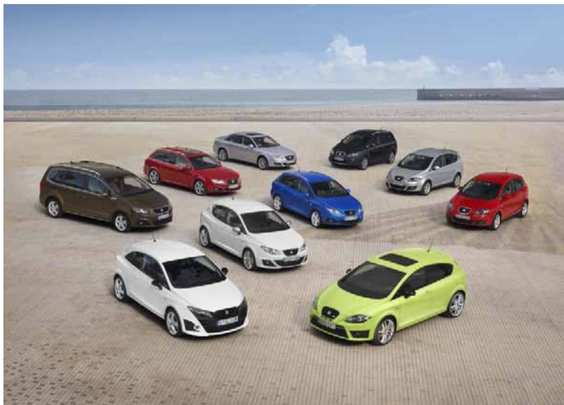
El éxito de ventas es fruto de la completa y competitiva gama de modelos que dispone la marca.