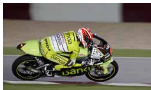
Nico Terol empezó la temporada con victoria.