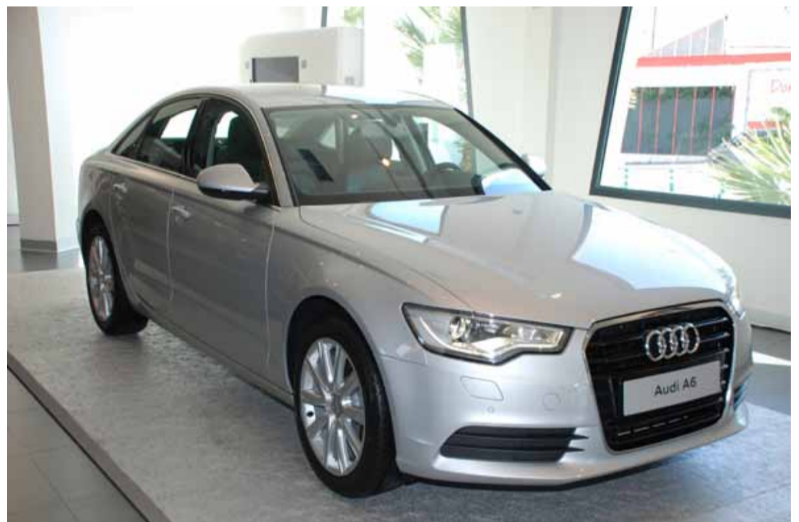
La perspectiva lateral ofrece una imagen de majestuosa elegancia, con unas tensas superficies delimitadas por bordes afilados.