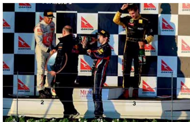
Podio Australia 2011: 1º Vettel, 2º Hamilton y 3º Petrov.

La F1 es una continua evolución. Cada año se introducen cambios y, en este sentido, habrá que esperar el plato fuerte que nos servirán en 2013. Los motores pasarán de V8 a cuatro cilindros, se reducirán considerablemente los alerones, para compensar la pérdida de adherencia parece que volverá a funcionar el efecto suelo y a neumáticos notablemente más anchos. Y todo para abaratar costes. Los coches serán más difíciles de conducir y la exigencia de prestaciones no será