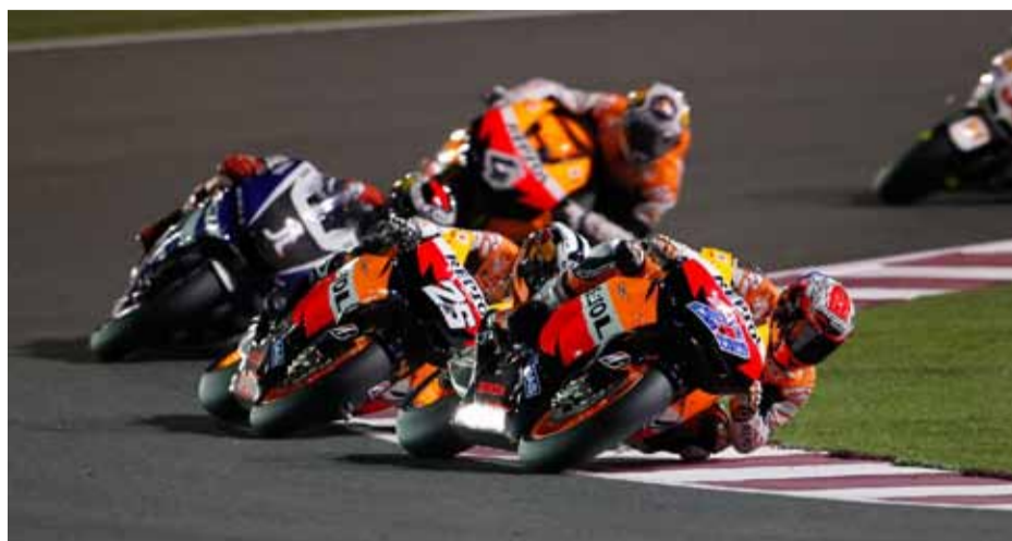
Desde el inicio se planteó una bonita lucha. Pronto Stoner dejaría clara su superioridad.

Texto: Yiyo Dorta