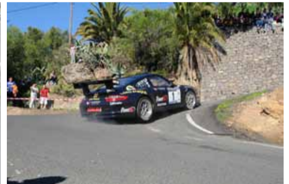
3º Viera/Pérez necesitan más adaptación al Porsche.